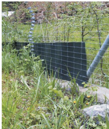
Plaques pour protection de clôture amphibiens sur vole d'accès à une autoroute: N2, Eptingen, BL