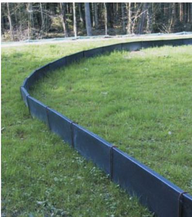
Clôture de protection amphibiens route de canton à Vordemwald AG