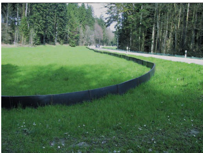
Type A) Plaques isolées à partie supérieure angulaire