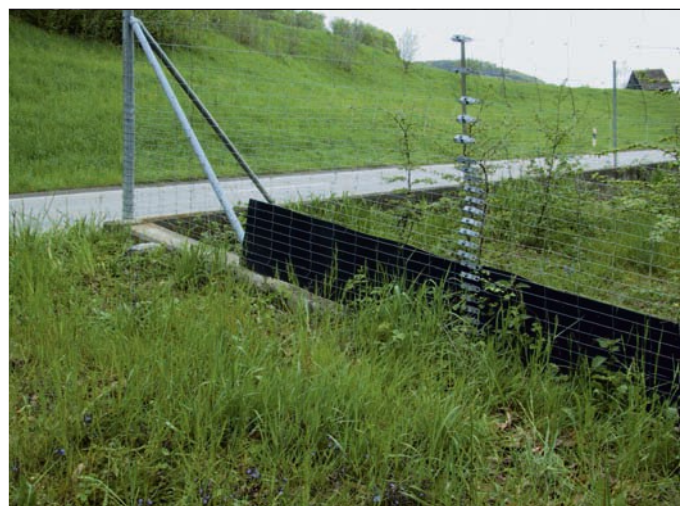
Type B) Plaques à fixer sur des grillage (par exemple grillage à noeuds)